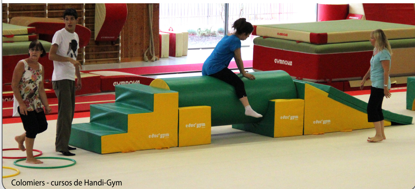
Colomiers - cursos de Handi-Gym

Adquirir los reflejos de la vida cotidiana