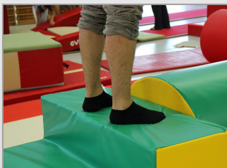
FIRMEZA DE LA ESPUMA