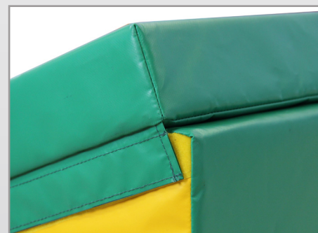
VELCRO DE UNION

Todos los productos de la gama Handi-Gym responden a las necesidades y expectativas de las personas discapacitadas.