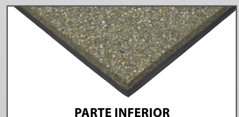
Espuma aglomerada de poliuretano