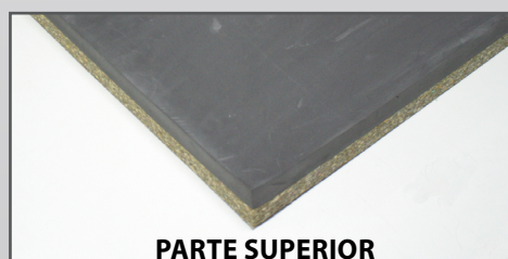
Espuma de polietileno

* Parte superior => 3 cm de espuma de polietileno